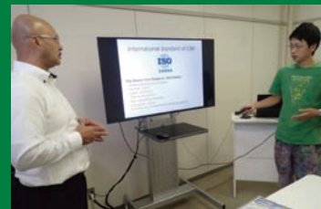
聴衆を惹きつける話し方、身振り手振りを指導