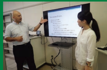
効果的な PowerPoint スライドの提示方法を解説