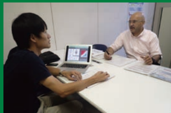
英語プレゼンの構成に関する相談に対応

口頭発表やポスター発表など、国際学会に向けた発表準備に取り掛かるにあたり、こうした疑問を持たれたことがある方は少なくないはず。この機会に Academic English Support Desk の 専門性の高いネイティブ・インストラクターによる個人指導 (チュートリアル) の受講を通じて、基礎から応用まで、英語プレゼンテーションを成功させる秘訣を学んでみませんか。