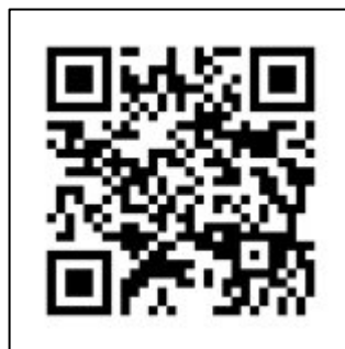
船場図書館Webサイト