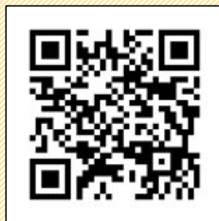
箕面市立船場図書館 Webサイト